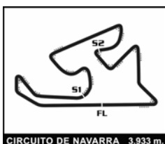
CIRCUITO DE NAVARRA 3.933 m.