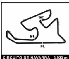
CIRCUITO DE NAVARRA 3.933 m.